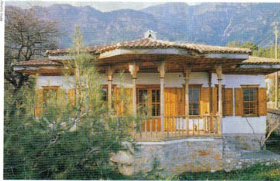
Nail Çakırhan tarafından tasarlanmış başka bir ev