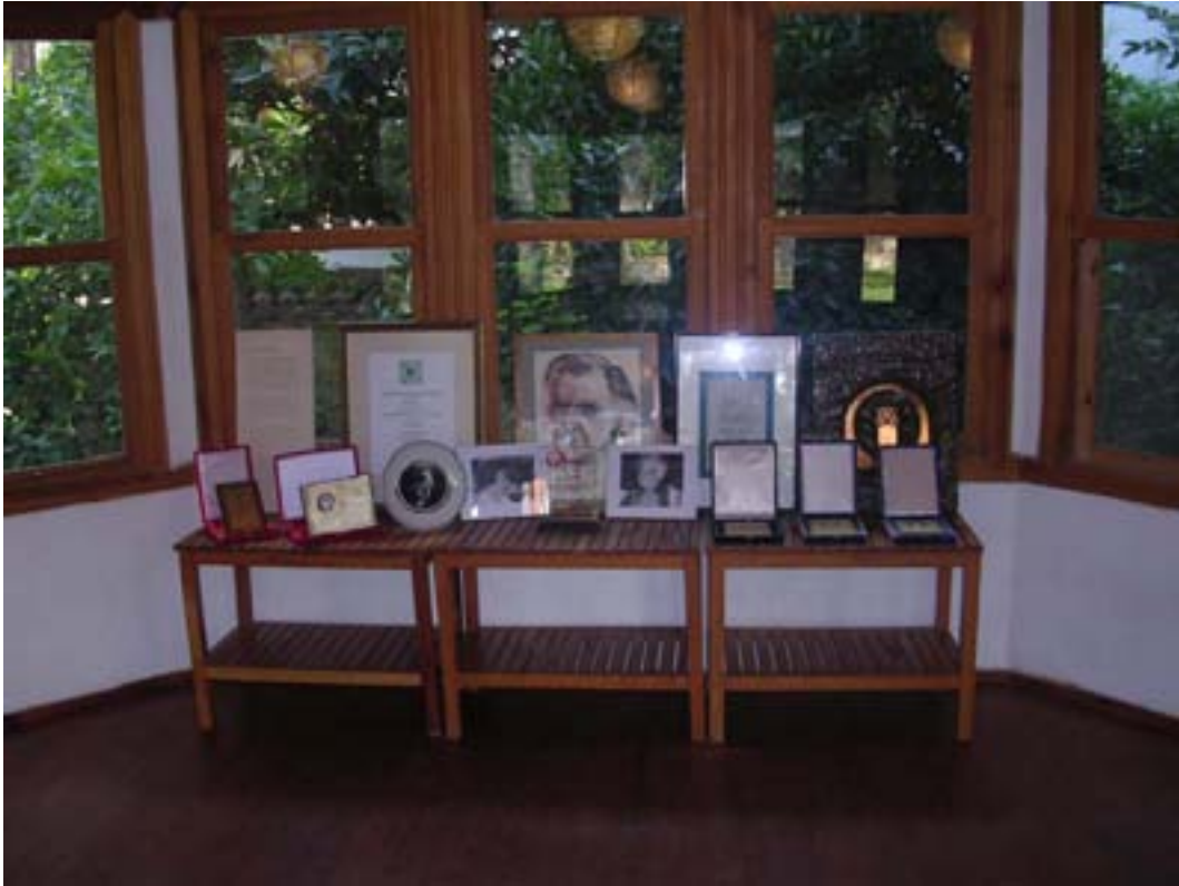
Nail Çakırhan & Halet Çambel Kültür ve Sanatevi'nde Nail Çakırhan ödül köşesi