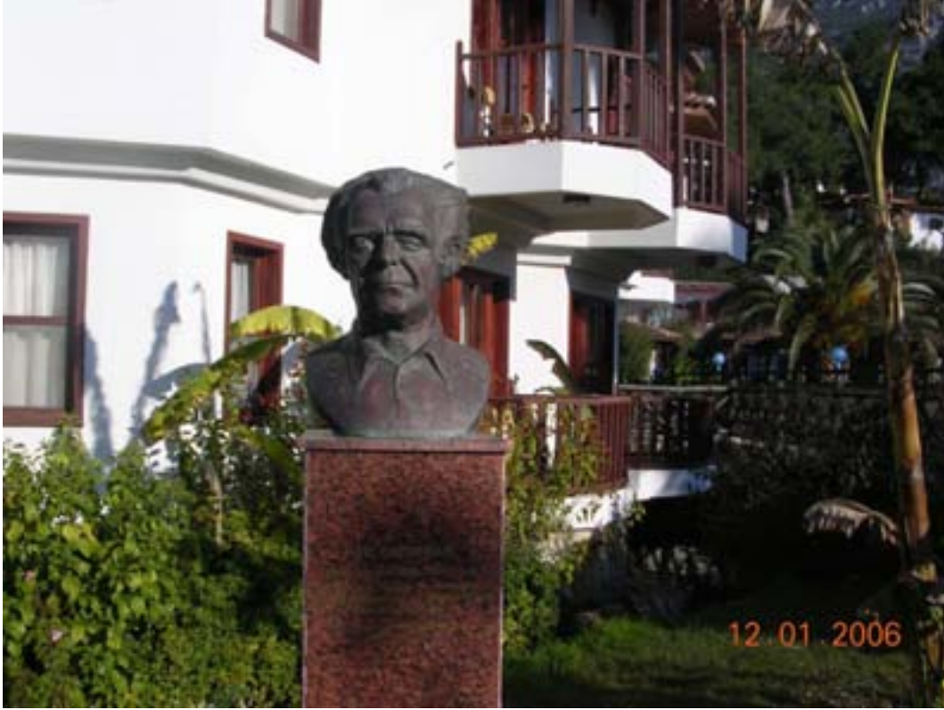
NAİL ÇAKIRHAN BÜSTÜ Yücelen Tesisleri bahçesinde