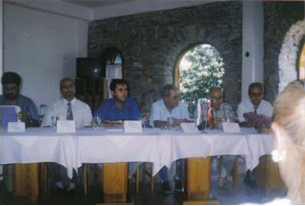
31.08.1996 Dedegil Oteli

Dedegil Oteli'nde yapılan panele ben de katıldım. Gökova'nın Tarihi konusunda derlediğim bilgileri sözlü olarak aktardım. Panele katılan tüm konuşmacılar sözlü açıklamalarda bulundu. Ben daha sonraları bu notları yazılı hale getirdim. İŞTE GÖKOVA bülteninde yayınlandı. Bu çalışmaların başlangıcı kilometre taşı oldu.