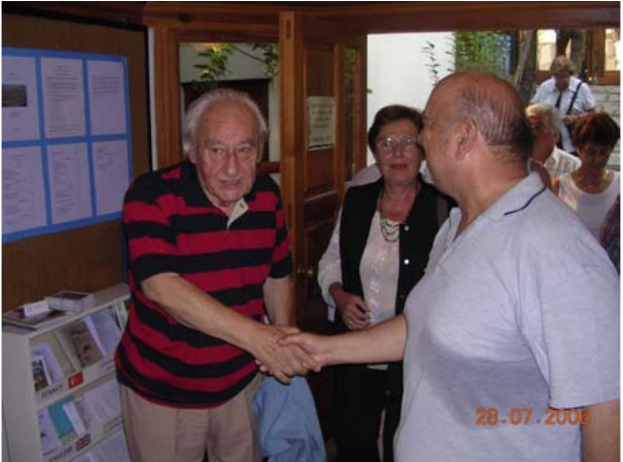
İdyma'dan Akyaka'ya adlı sergide

Akyaka'da evi olan ve evinin olduğu sokağa ismi verilen yazar hakkında geniş bilgi aşağıdadır. " http://tr.wikipedia.org/wiki/Oktay_Akbal