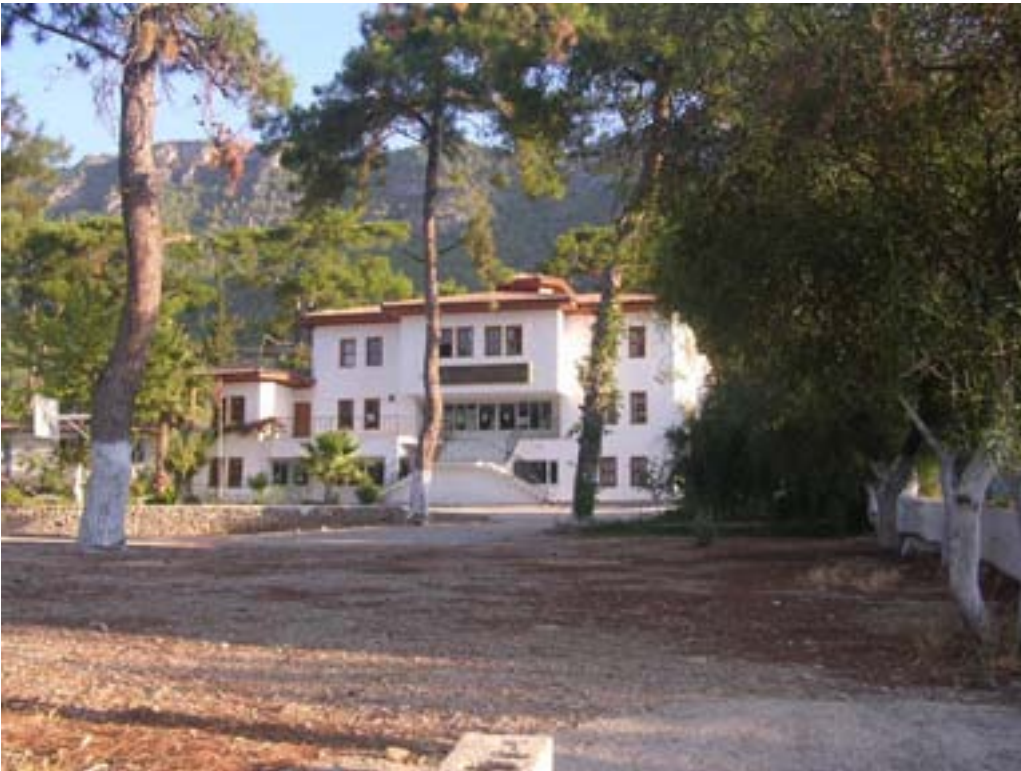
Akyaka Belkis & Cahit Güneymen İlköğretim Okulu