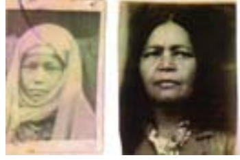
Gelin Durdu Akkaya (1935)