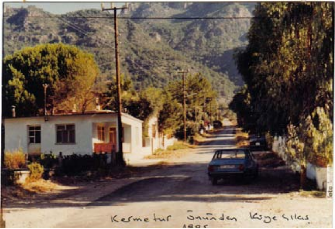
1985 yılında Kermetur'dan köye çıkan cadde (Lütfiye Sakıcı Caddesi)