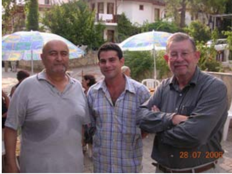
Idyma'dan Akyaka'ya sergisinde ođlu ile