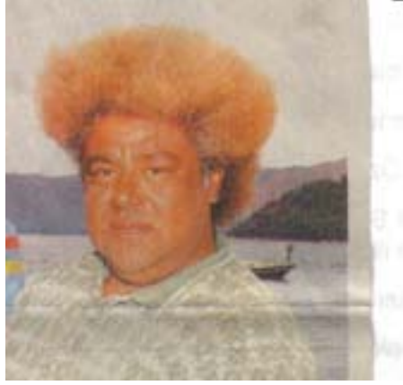
Hürriyet Gazetesi'nde çıkmış fotoğrafı