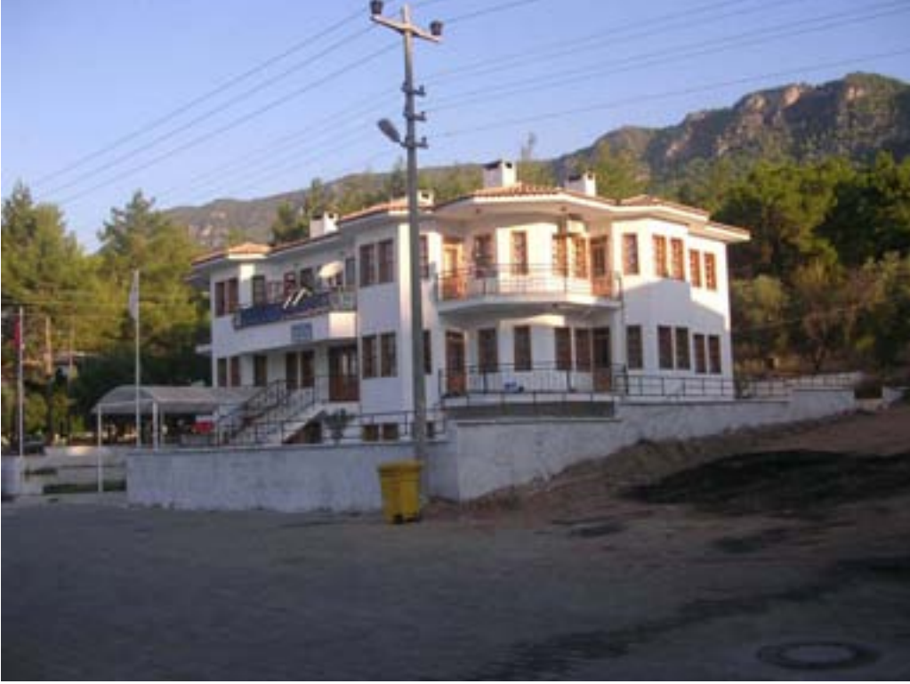
Akyaka Sağlık Ocağı