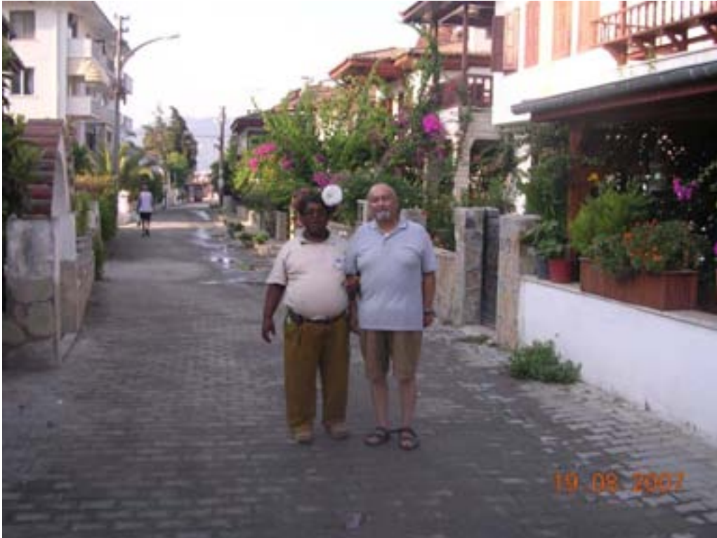
Bir sabah bira almaya geldiğinde başında çiçeklerle