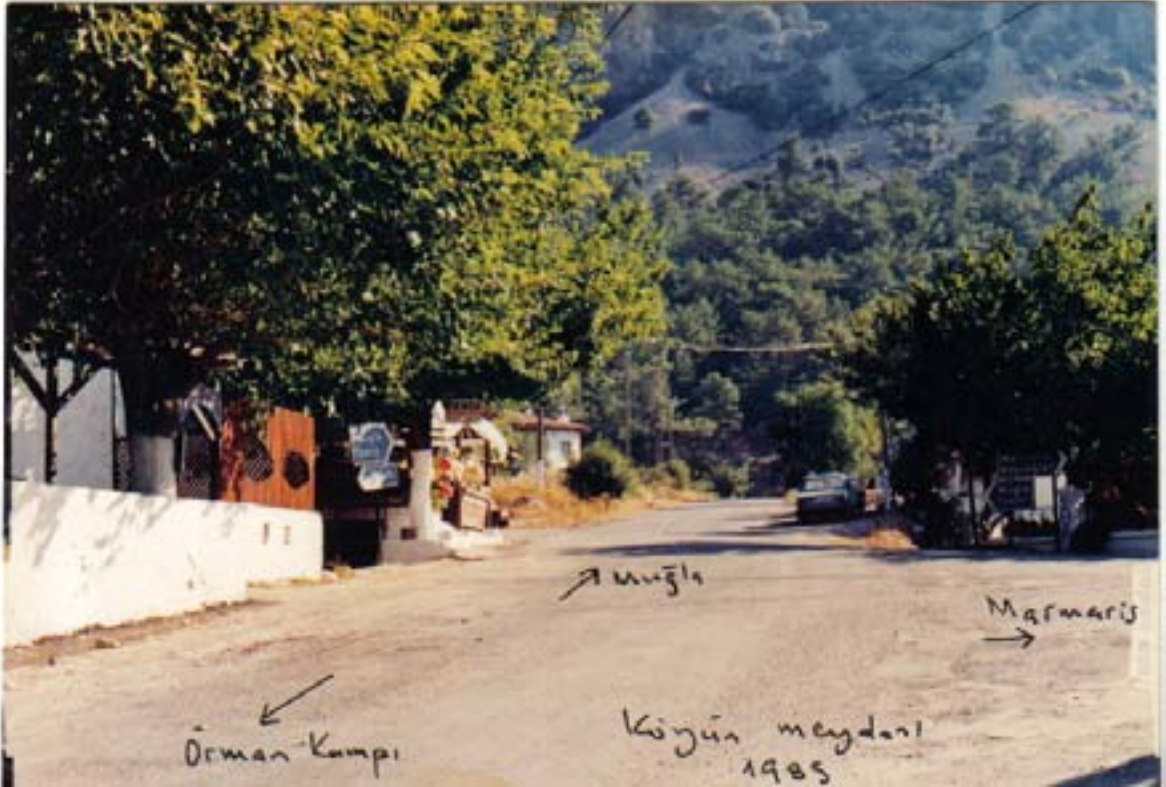
Köy Meydanı'nın 1985 tarihindeki durumu (Sağ tarafta Hüseyin Çavuş'un Kahvesi)