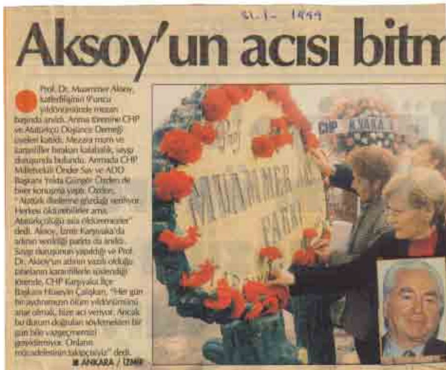
Savunduğu fikirler uğruna karanlık güçler tarafından öldürülen Muammer Aksoy