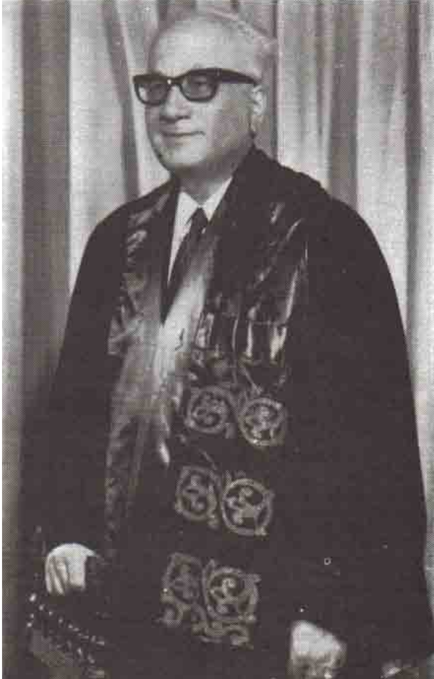
PROF SADİ IRMAK (1904-1990)