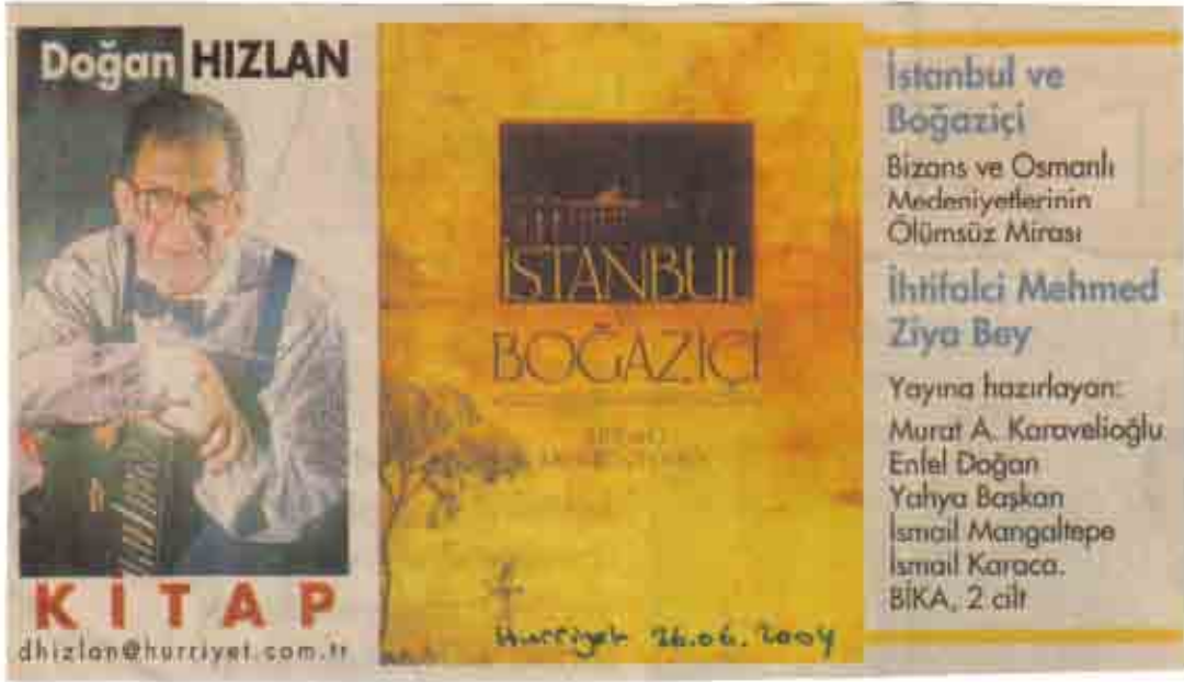
İhtifalci Mehmet Ziya'nın yeniden düzenlenerek basılan İstanbul ve Boğaziçi isimli kitabın kapağı

Mehmet Ziya Bey'i İstanbul'da meşhur eden asıl faaliyeti zor şartlar altında halkın moralini düzeltmek ve kendine güvenini artırmak için Türk tarihinin önemli olaylarının ve önemli kişilerinin ölüm yıldönümlerinde ihtifaller düzenlemesi ve konuşmalar yapmasıdır. İhtifalci lakabı buradan gelmektedir. Eyüp'te gömülüdür.