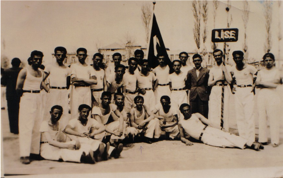
Konya Lisesi öğrencileri 19 Mayıs Gençlik Bayramı töreninde