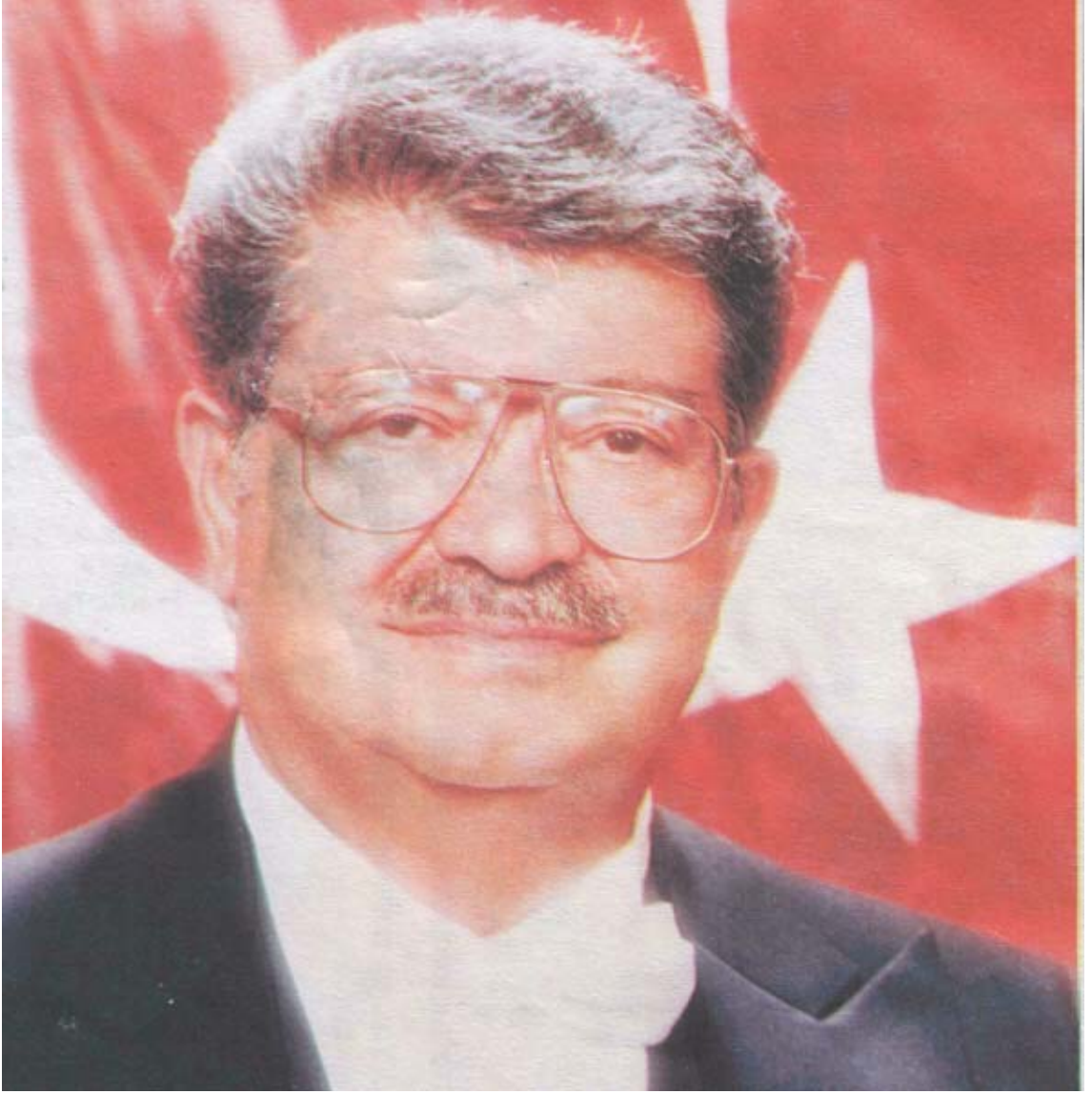
Konya Lisesi ğrencisi Turgut zal (1927-1993)

1944-1945 yıllarında Konya Lisesi ğrencisi