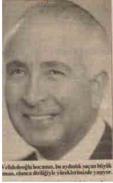
Velidedeoğlu hocamız, bu aydınlık saçını büyük inan, olanca diriliğiyle yüreklerimizde yaşıyor.

Konya Lisesi öğrencisi büyük hukukçu Hıfzı Veldet Velidedeoğlu