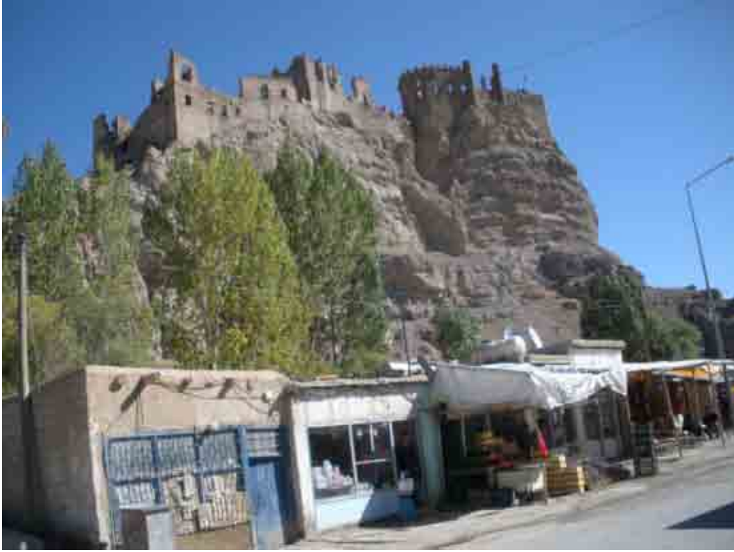
Hoşap Kalesi (Kale önünde peynir zeytin çay ile öğle yemeği)