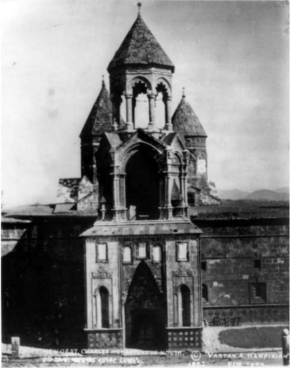
Muş Surp Garabet Manastırı Varaka Vank Bydigi (Internet)