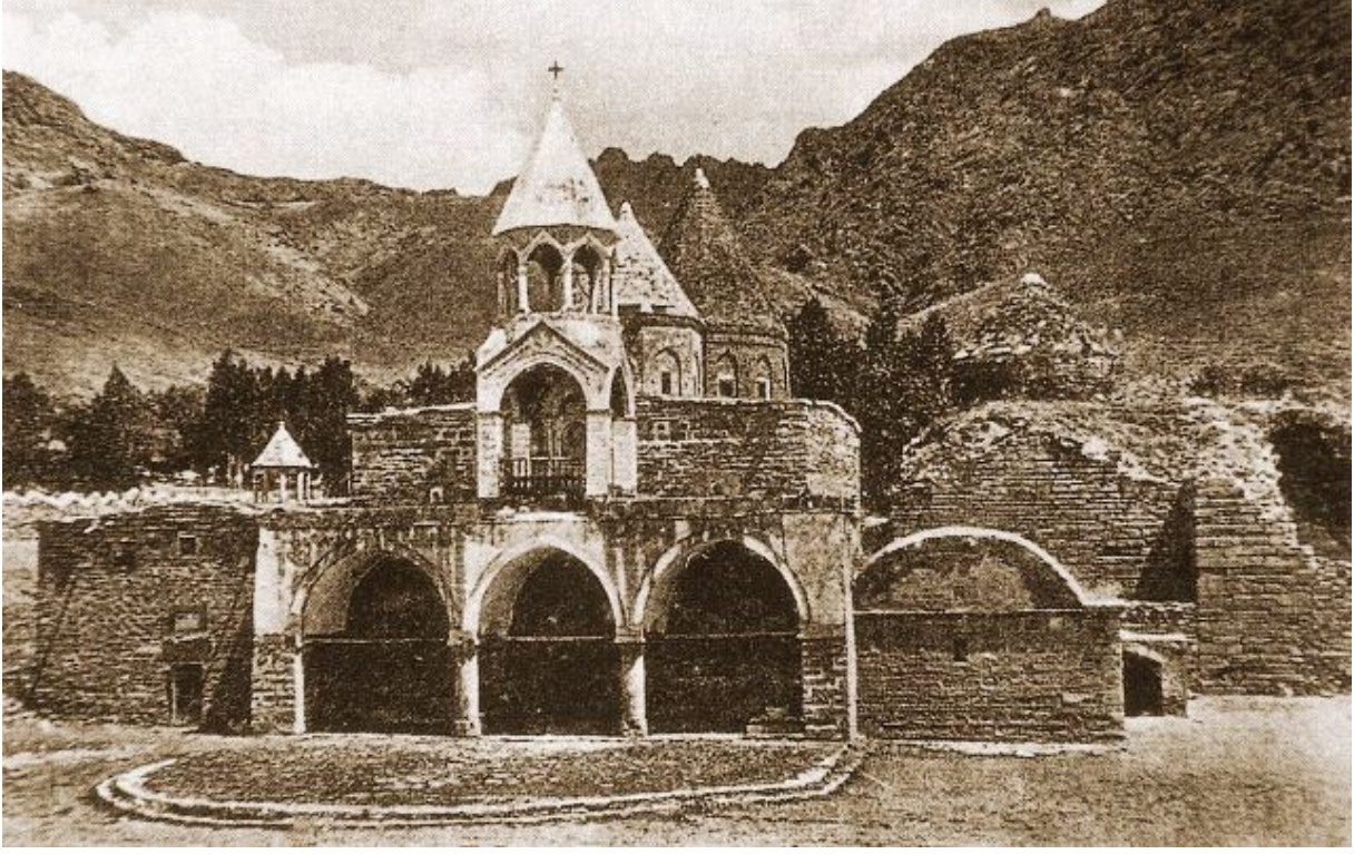
Van Erek dađında Varaka Vank Manastırđ