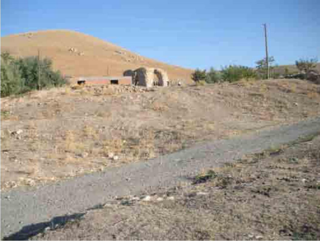
Elazığ eski Habap (Ekinözü) köyünde Kilise ? (Meryem Ana)