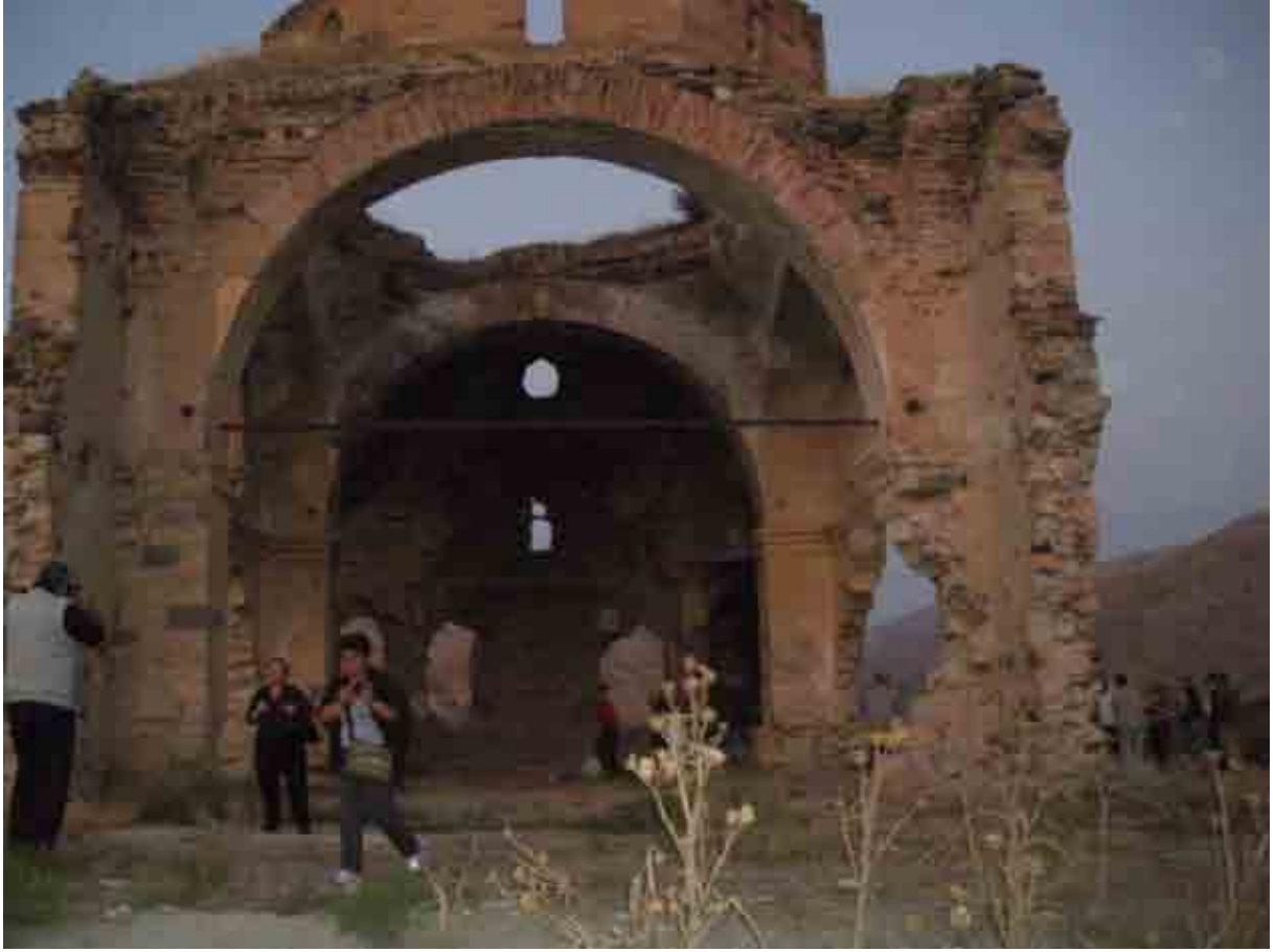
Palu Çarşıbaşı Ermeni kilisesi