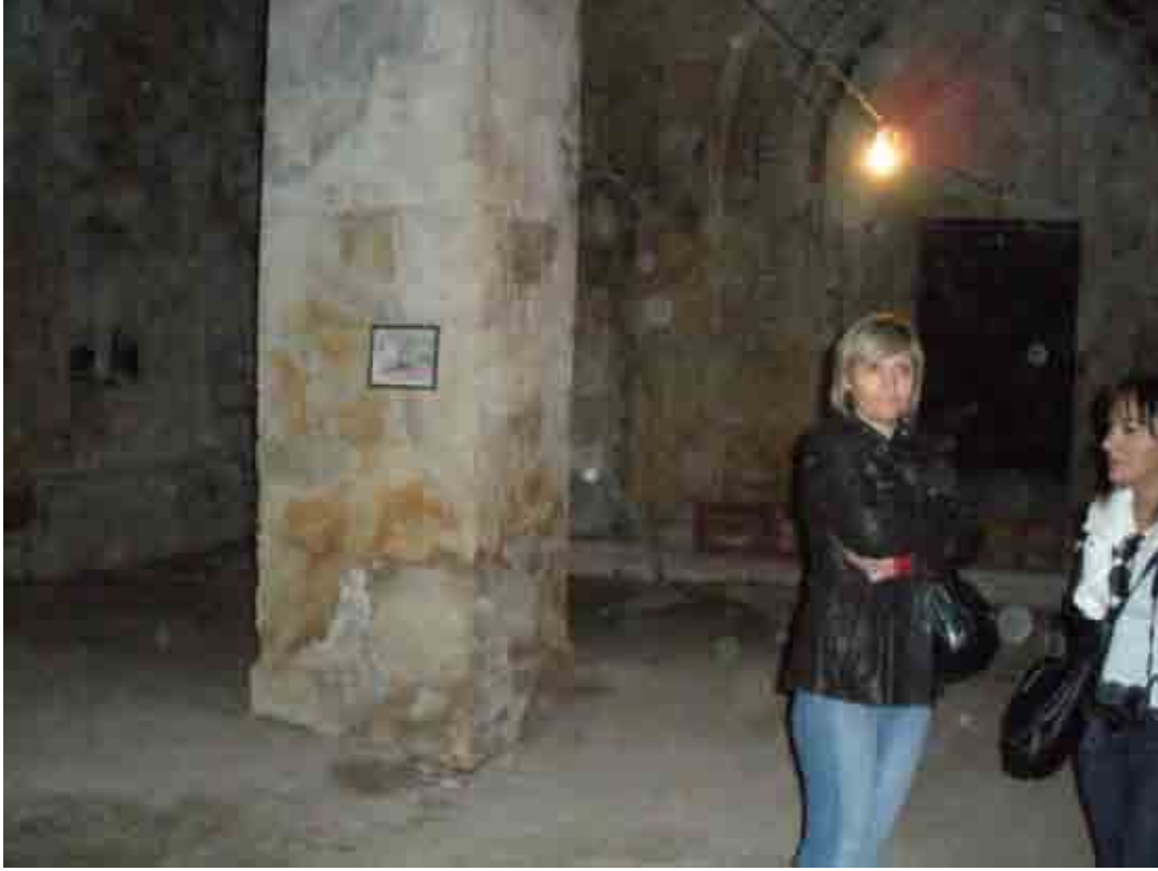
Erek Dağı Manastırı (Varaka Vank) yada Yedi Kilise içinde