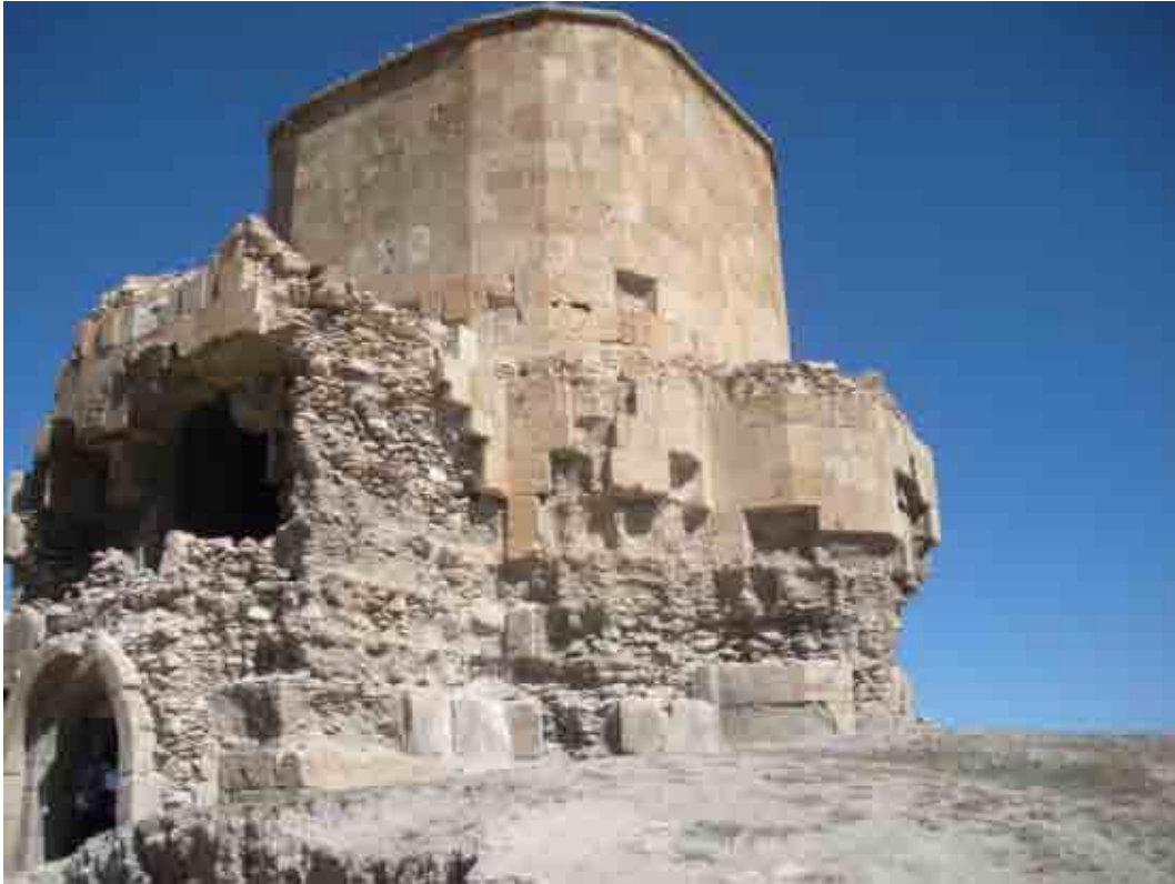
İran sınırına çok yakın Sorader (Kızıl Kilise) Manastırı Çok değişik bir mimarisi var.