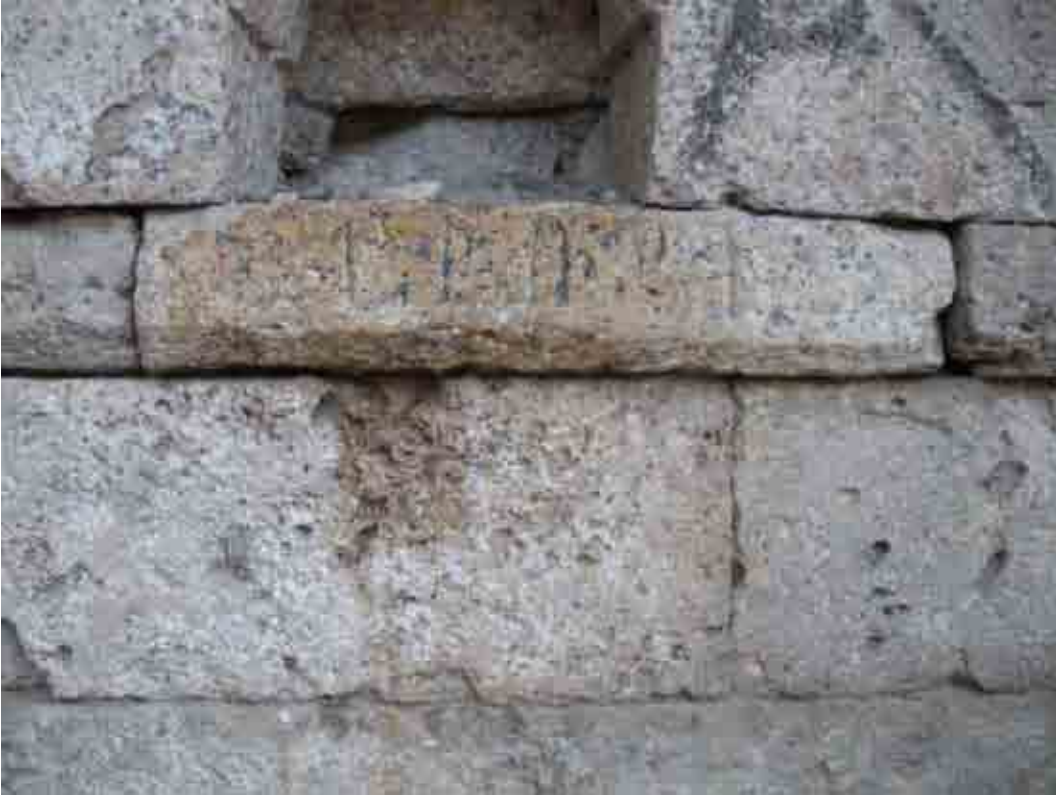
Habap (Ekinözü) köyünde tarihi çeşme üzerinde yazıt