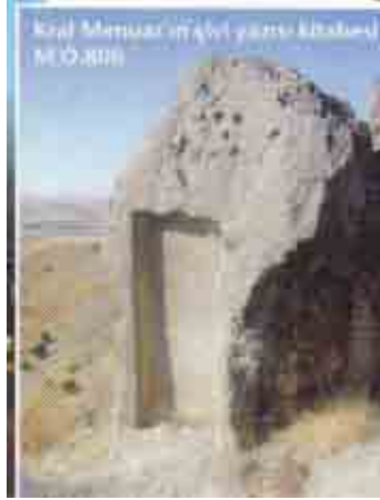
Urartu Kralı Menua'ya ait yazıt