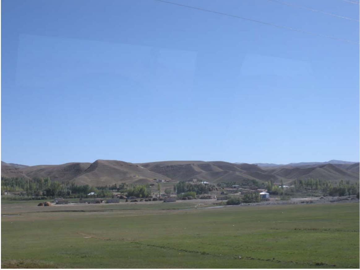
İran sınırına çok yakın Urartu dönemi Gelincik barajı (tamamen dolmuş) Otobüsle geçerken farkına varıyorum, büyük keyif alıyorum