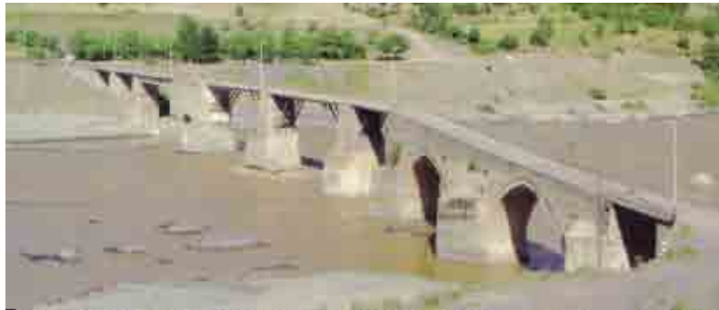
Palu'da tarihi Ortaçağ köprüsü