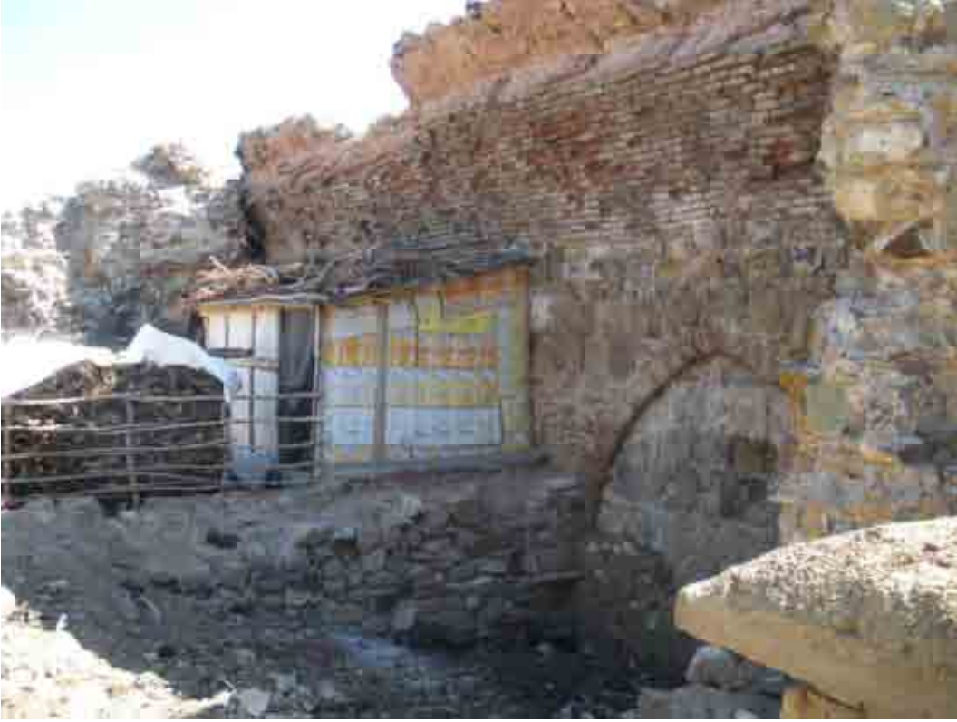
Surp Garabet Kilisesinin evler altında kalan duvarları