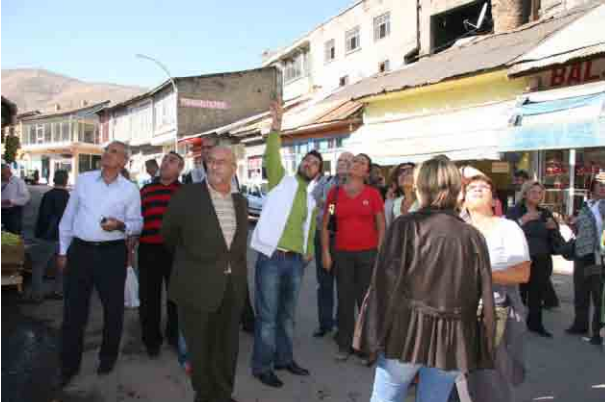
Muş içinde gezinti